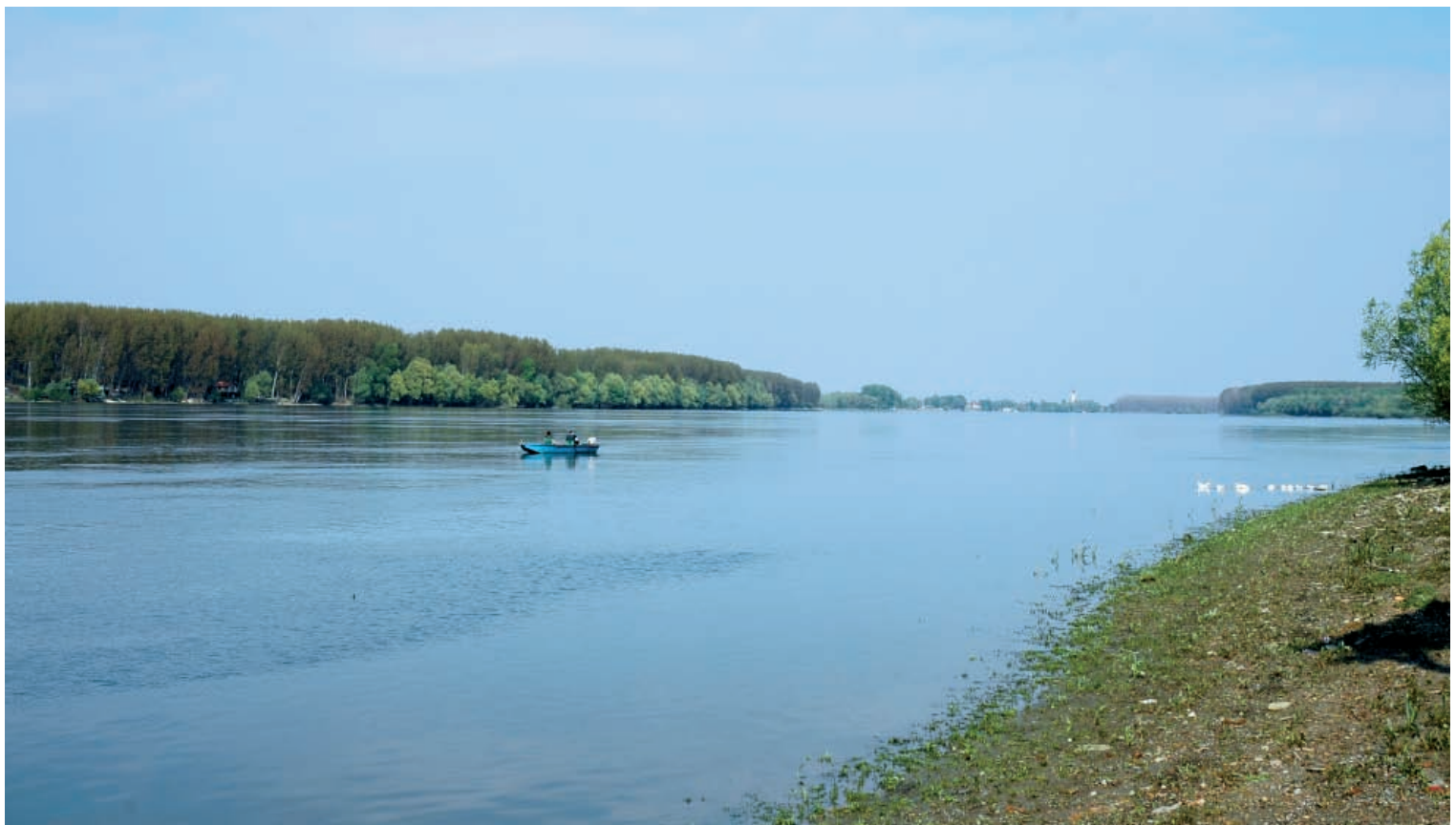
Pogled na Futog sa obale Dunava kod Čerevića / A view of Futog from the Danube bank at Čerević

Present day settlement stands to the east of Begeč, on the Danube bank, also in visual contact with the Roman fort Bononia–Malata. Several Roman monuments with inscriptions and single finds of Roman coins were recovered in the vicinity of the town.